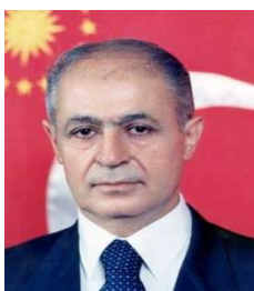
აჰმედ ნეჯდეთ სეზერი

თურქეთის რესპუბლიკის პრემიერ-მინისტრის ბ. ეჯევითის მიერ პრეზიდენტობის კანდიდატად დასახელებულ იქნა საკონსტიტუციო სასამართლოს თავმჯდომარე აჰმედ ნეჯდეთ სეზერი, რომელსაც ყველასათვის მოულოდნელად მხარი დაუჭირა მეჯლისში შემავალი ხუთივე პარტიის ლიდერმა და შეთანხმდნენ ერთ საერთო კანდიდატზე.