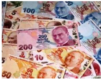
ახალი თურქული ლირა

რიკატებზე და ბოლოს 50%-დან 10%-მდე ნედლეულზე. მნიშვნელოვნად გაიზარდა ქვეყნის ეკონომიკაში დაბანდებული უცხოური კაპიტალის ოდენობა. გარდა ამისა, მათ იზიდავდა თურქეთის უაღრესად ხელსაყრელი გეოპოლიტიკური ადგილმდებარეობა, განლაგებული, როგორც ხშირად ამბობენ, ხიდზე ევროპასა და აზიას შორის (აღმოსავლეთსა და დასავლეთს შორის).